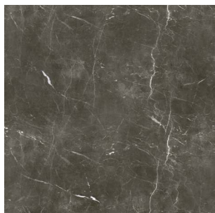
2992 2 / 4 m