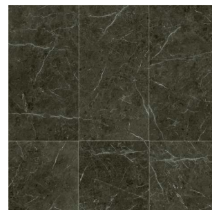
2998 2 / 4 m