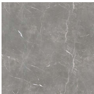
2991 2 / 4 m