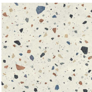
2946 2 / 4 m