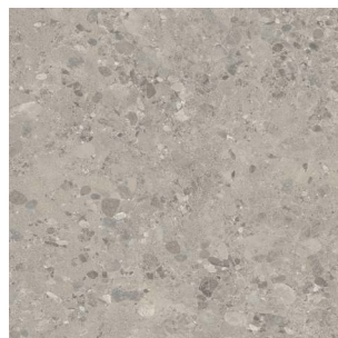
2996 2 / 4 m