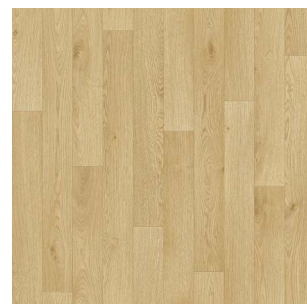
2325 3 / 4 m