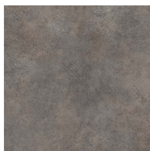
2321 2 / 3 / 4 m