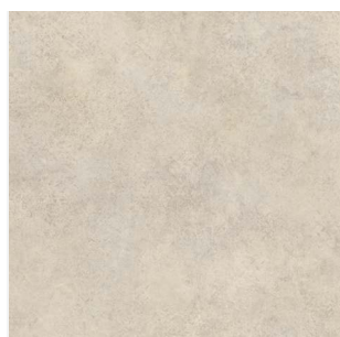
2320 2 / 3 / 4 m