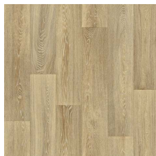
2329 3 / 4 m