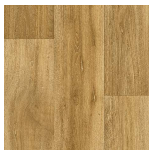
2317 2 / 4 m