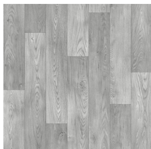
2324 3 / 4 m