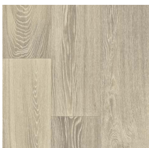
2319 2 / 3 / 4 m