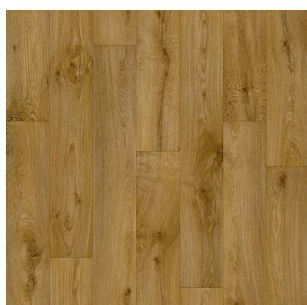
2326 3 / 4 m