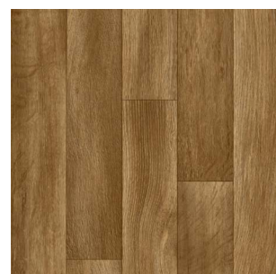
2318 2 / 3 / 4 m