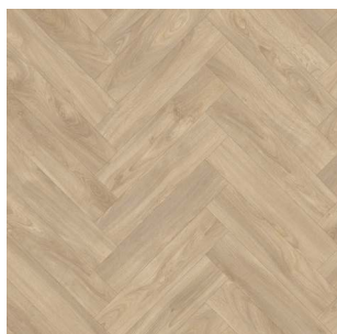
2323 3 / 4 m